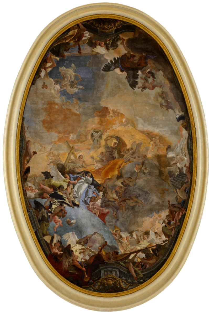
Giambattista Tiepolo, Incoronazione della Vergine, 1755.

Affresco sul soffitto della Chiesa della Pietà, Venezia.