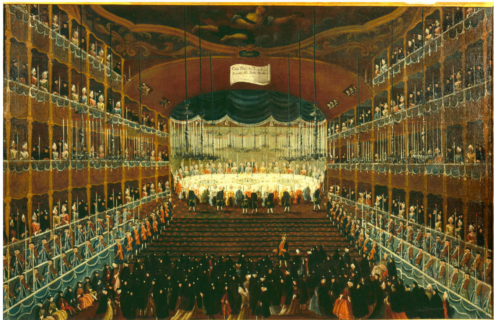
Gabriel Bella, Cena al Teatro di San Benedetto per i Duchi del Nord Olio su tela, 1782

A fare da cornice è anche un certo ambiente umano, tipico di Venezia, così magistralmente descritto dall'avvocato Carlo Goldoni nelle sue commedie, con quel ciaccolàr così dolce e, soprattutto, musicale.