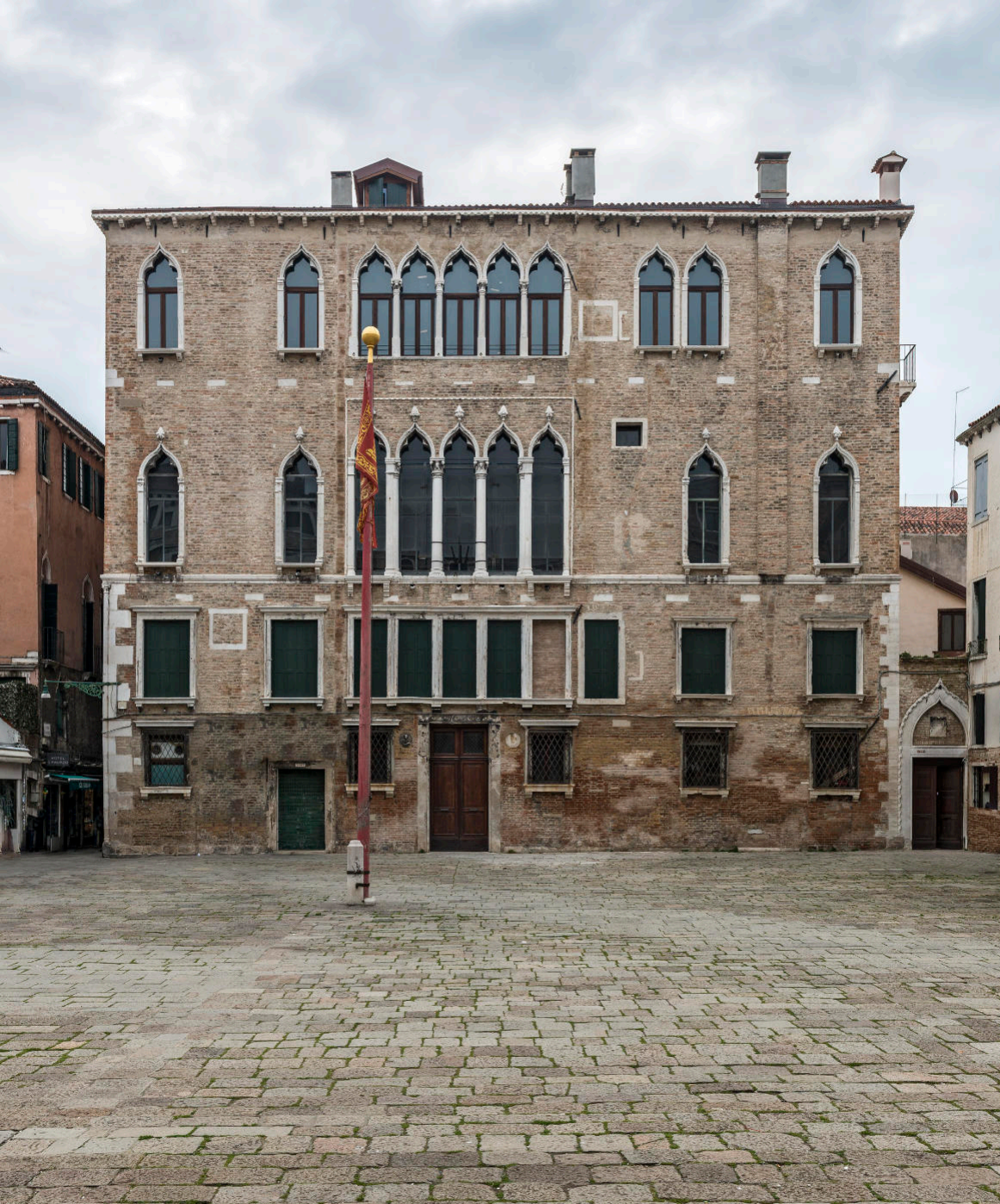
Palazzo Zaguri, Campo San Maurizio, Venezia Già dimora del patrizio Pietro Zaguri, amico e mecenate di Giacomo Casanova.