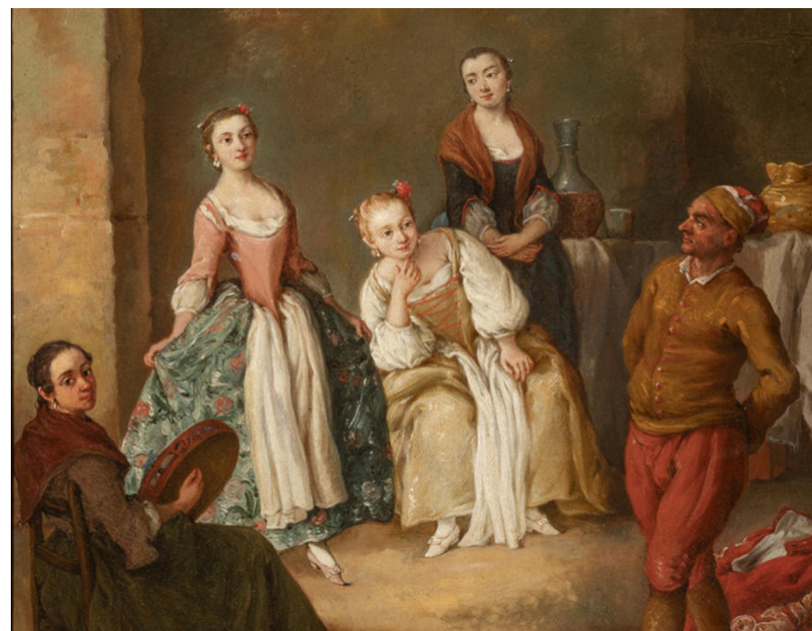
Pietro Longhi, La Furlana Olio su tela, Casa di Goldoni, Venezia

«Il giorno seguente, ordinai al mio infame paggio di andarmi a cercare uno spagnolo che avrei pagato perché mi insegnasse a ballare il fandango; mi portò un commediante che assunsi per darmi lezioni di spagnolo. Ma quel giovanotto, in soli tre giorni, mi insegnò così bene l'andamento di quella danza che, per ammissione stessa degli spagnoli, non c'era persona a Madrid che potesse vantarsi di ballare meglio di me».