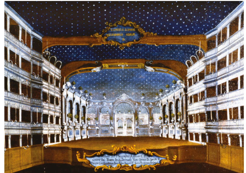
Gabriel Bella, Interno del teatro San Samuele di Venezia Olio su tela, ca. 1770–1790

Giacomo Casanova nasce il 2 aprile 1725 in una casa nei pressi del teatro San Samuele di Venezia. Il padre, Gaetano Casanova, è un abile ballerino e attore originario di Parma, che riesce nel 1723 a farsi scritturare presso il teatro San Samuele, posseduto dai fratelli Grimani di Santa Maria Formosa. I lungimiranti Grimani possiedono all'epoca ben quattro teatri: quello di San Samuele, oggi non più esistente, è frequentato da personaggi illustri come Antonio Vivaldi e Carlo Goldoni. Quest'ultimo, padre della commedia moderna e coetaneo della madre di Giacomo, è direttore del teatro quando ottiene il primo grande successo con Il momolo cortesàn , commedia destinata a rivoluzionare il modo di fare teatro.