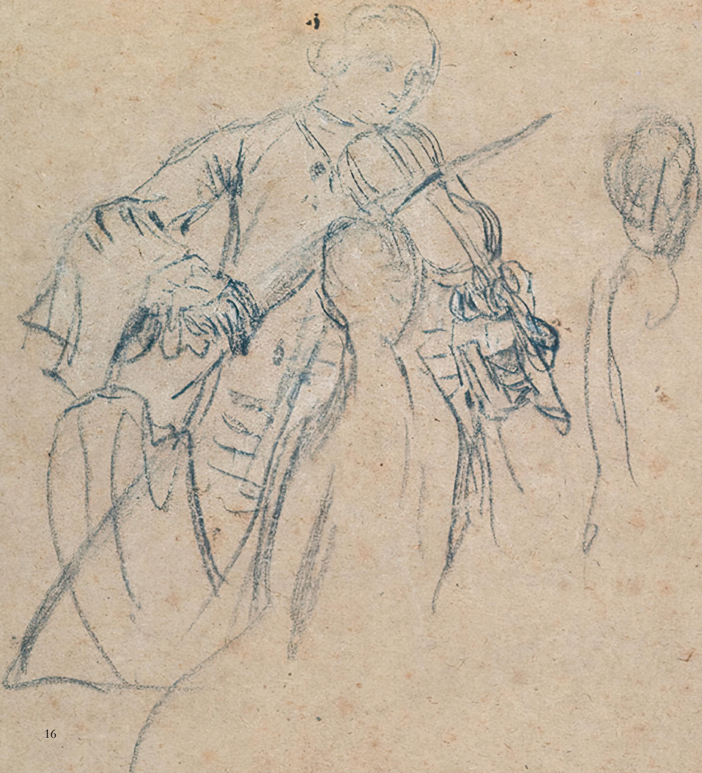
Pietro Longhi, Il violinista Matita su carta, Venezia, XVIII secolo Museo Correr