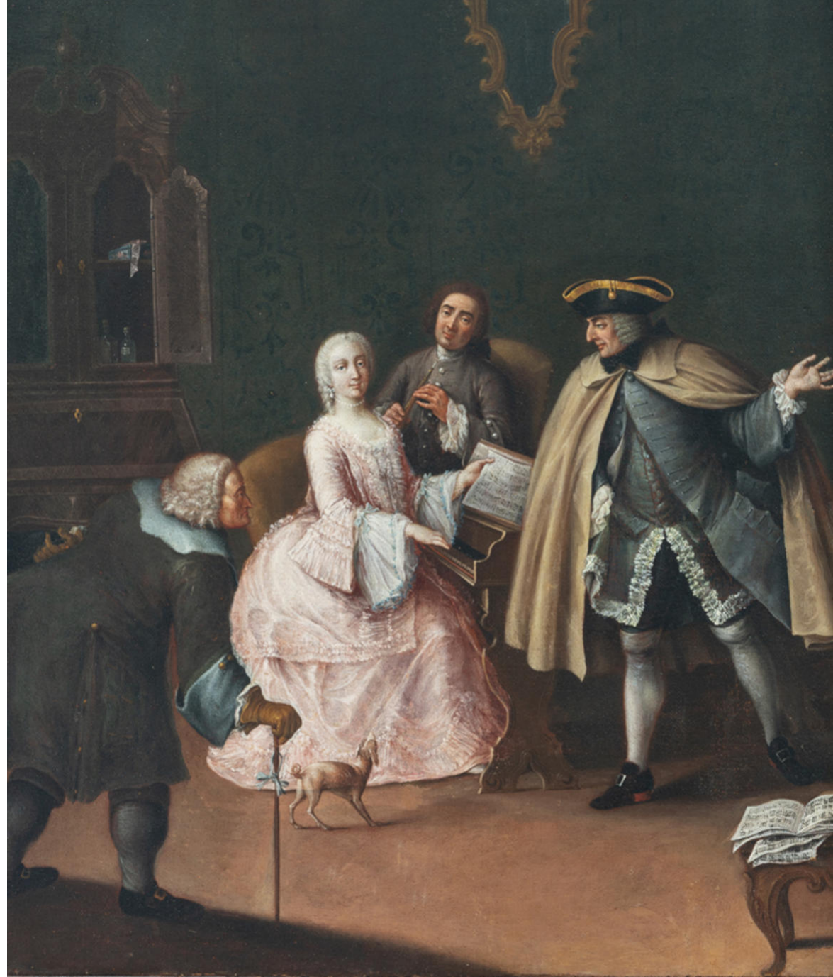
Scuola di Pietro Longhi, La lezione di musica Olio su tela, Casa di Carlo Goldoni, Venezia

Nel 1734 Goldoni la scrittura per il ruolo principale nella sua commedia La Pupilla . In seguito, viene chiamata al teatro di corte dello zar a San Pietroburgo e, nel 1737, accetta l'invito dell'Elettore di Sassonia e re di Polonia, Augusto III, entrando a far parte della Commedia italiana del teatro di Dresda con un incarico a vita. Qui si svolge il resto della sua carriera fino al pensionamento, nel 1756, causato dallo scoppio della guerra dei Sette Anni. Muore a Dresda nel 1776.